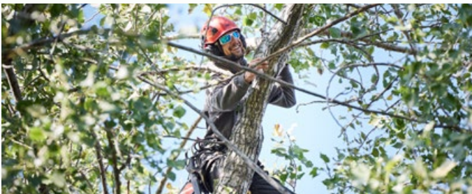
Projet de promotion des emplois