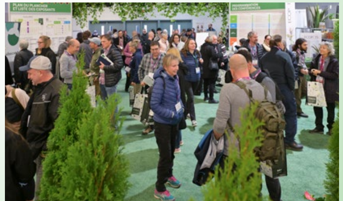
Expo Québec Vert