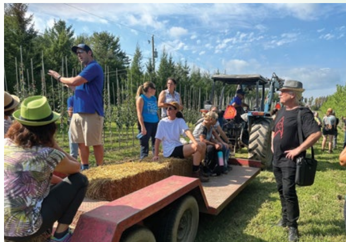
Gestion intégrée d'organismes nuisibles