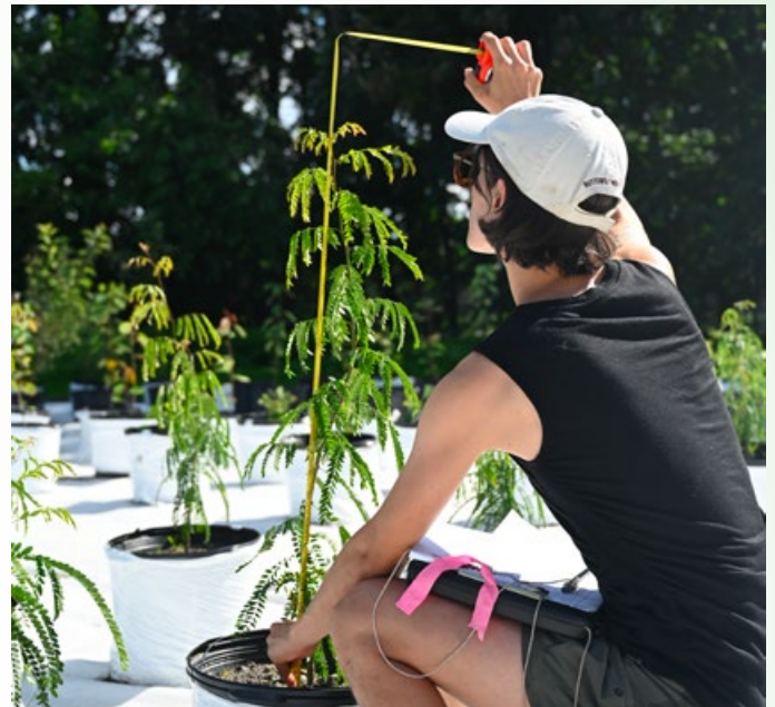
Grappe de recherche scientifique