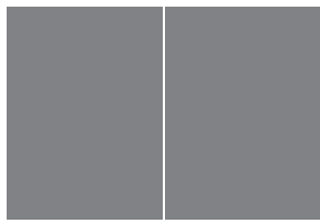
DOUBLE PAGE 15,66" X 10,75" + Marge perdue