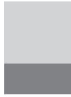
1/3 HORIZONTAL 7,83" X 3,61" + Marge perdue