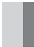
1/3 VERTICAL 2,66" X 10,75" + Marge perdue