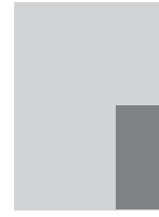
1/6 VERTICAL 2,66" X 5,42" + Marge perdue